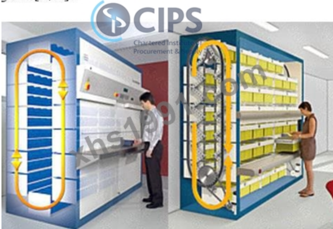
Carousel style storage