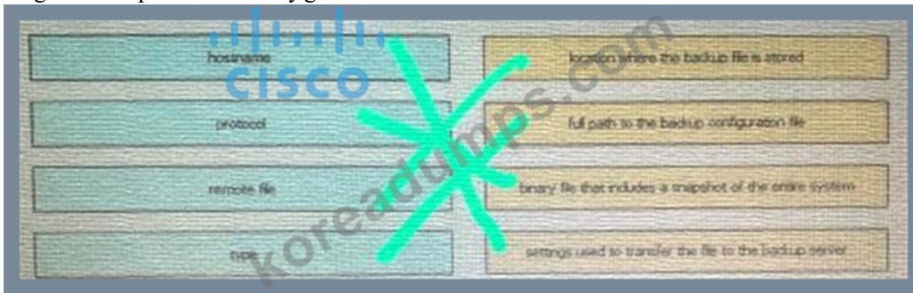
Diagram Description automatically generated