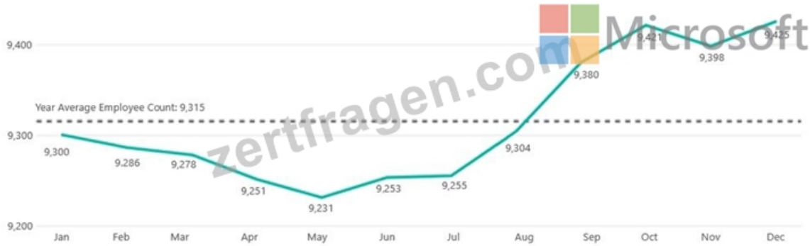
Prior Year Employee Count By Month

Use the drop-down menus to select the answer choice that completes each statement based on the information presented in the graphic.